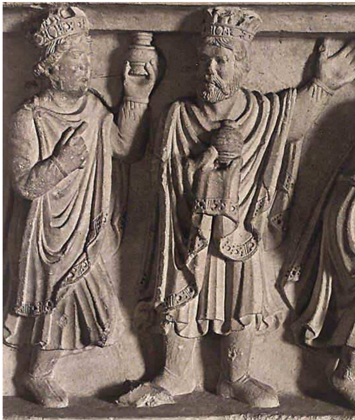
Benedetto Antelami relief Santa Maria Maggiore