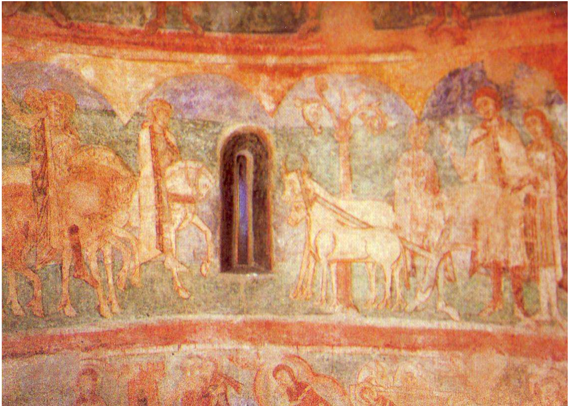
Povolání Přemysla Oráče na trůn