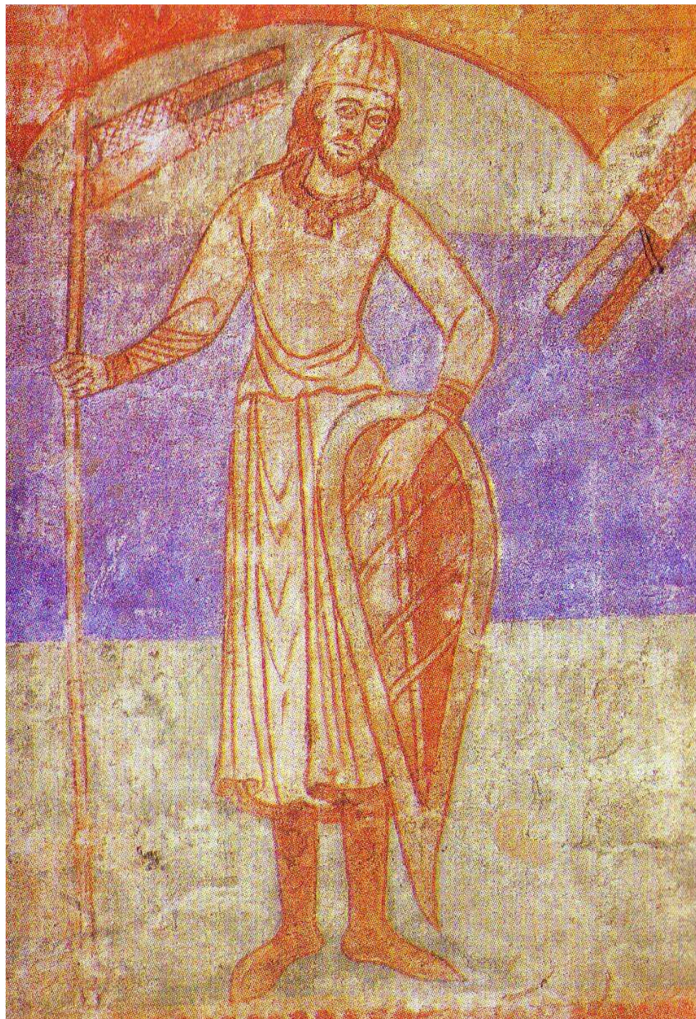
Moravský přemyslovec- úředlný kníže