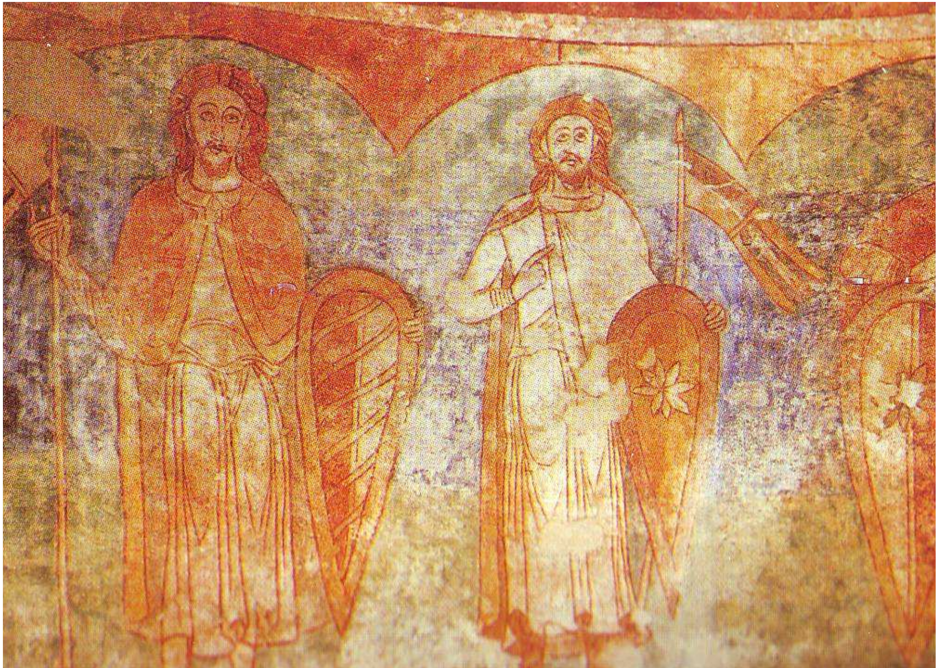
Pražská přemyslovská knížata