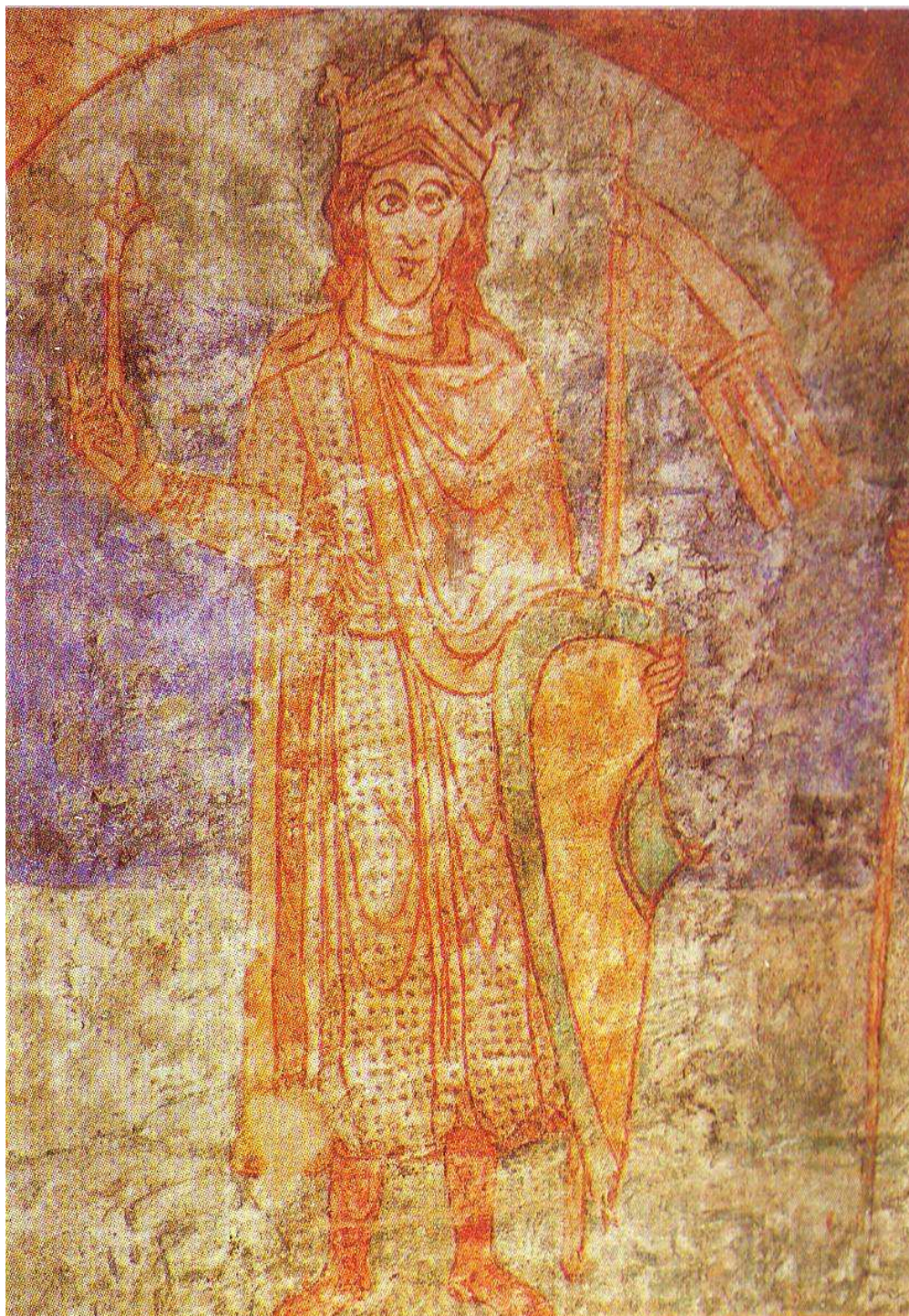
Postava prvního českého krále Vratislava II