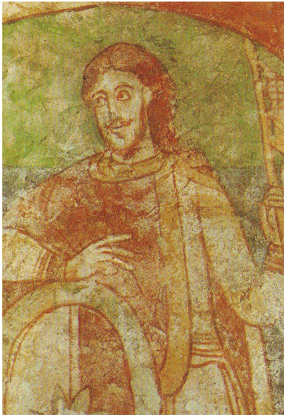
Detail postavy Přemyslovce