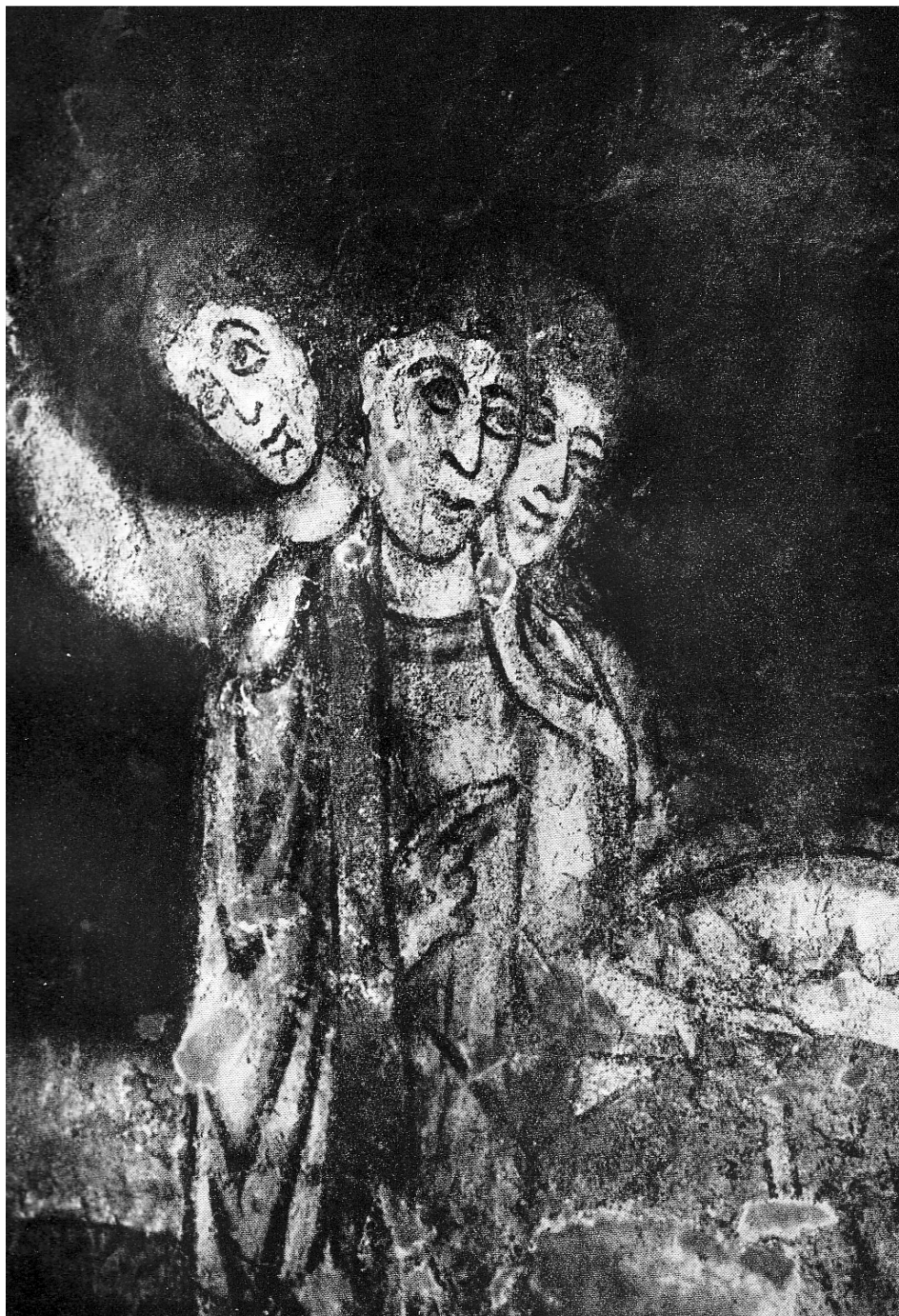
Snímek při ultrafialovém osvětlení,