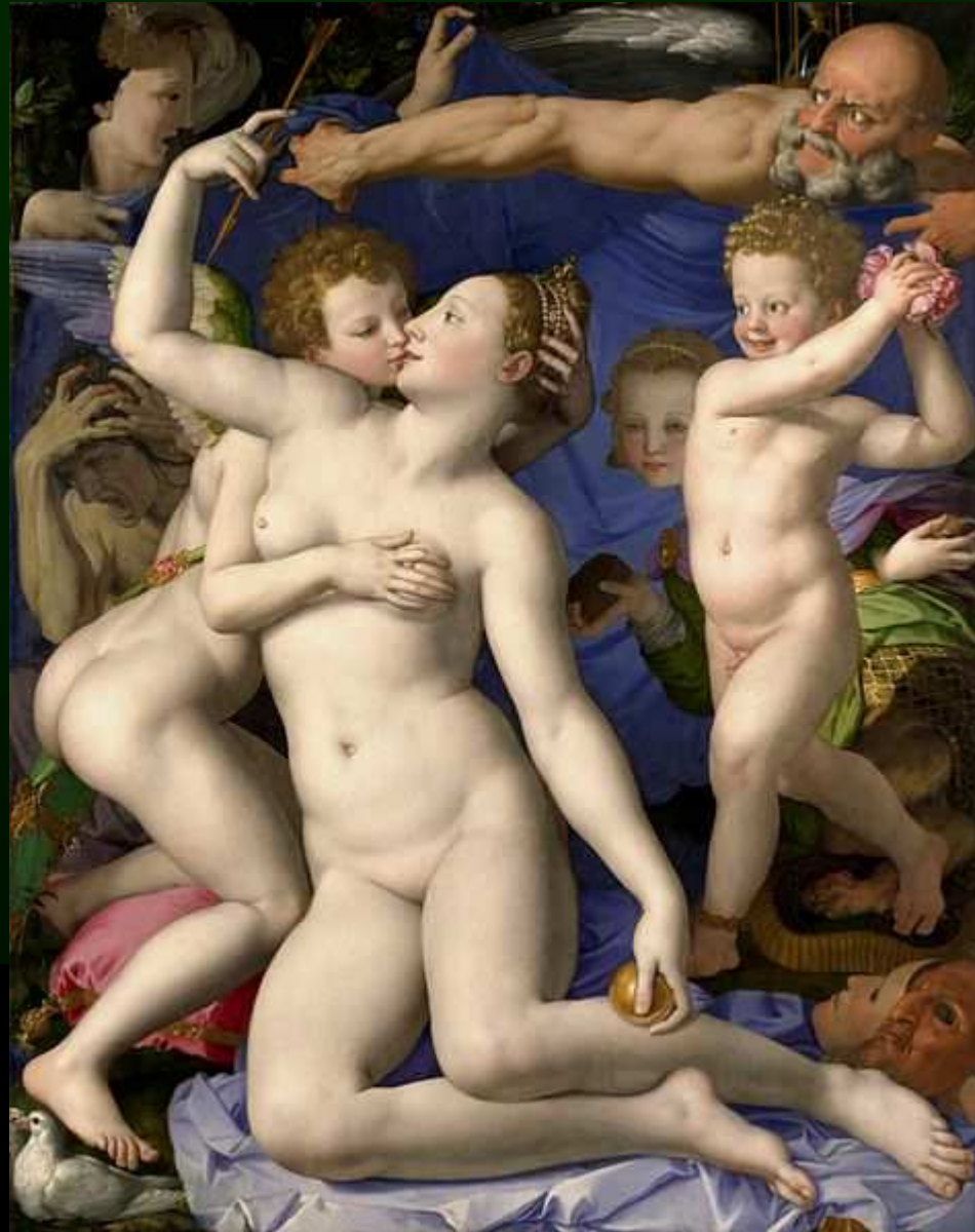
Venuše, Kupid a Čas - Alegorie Touhy, 1540- 1545, National Gallery, Londýn