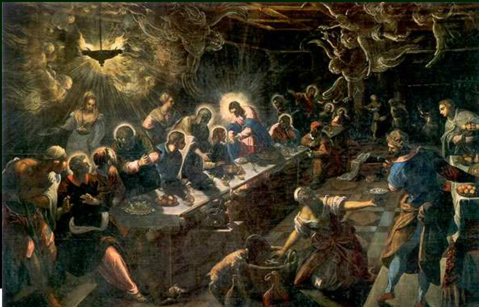
Poslední večeře, 1594