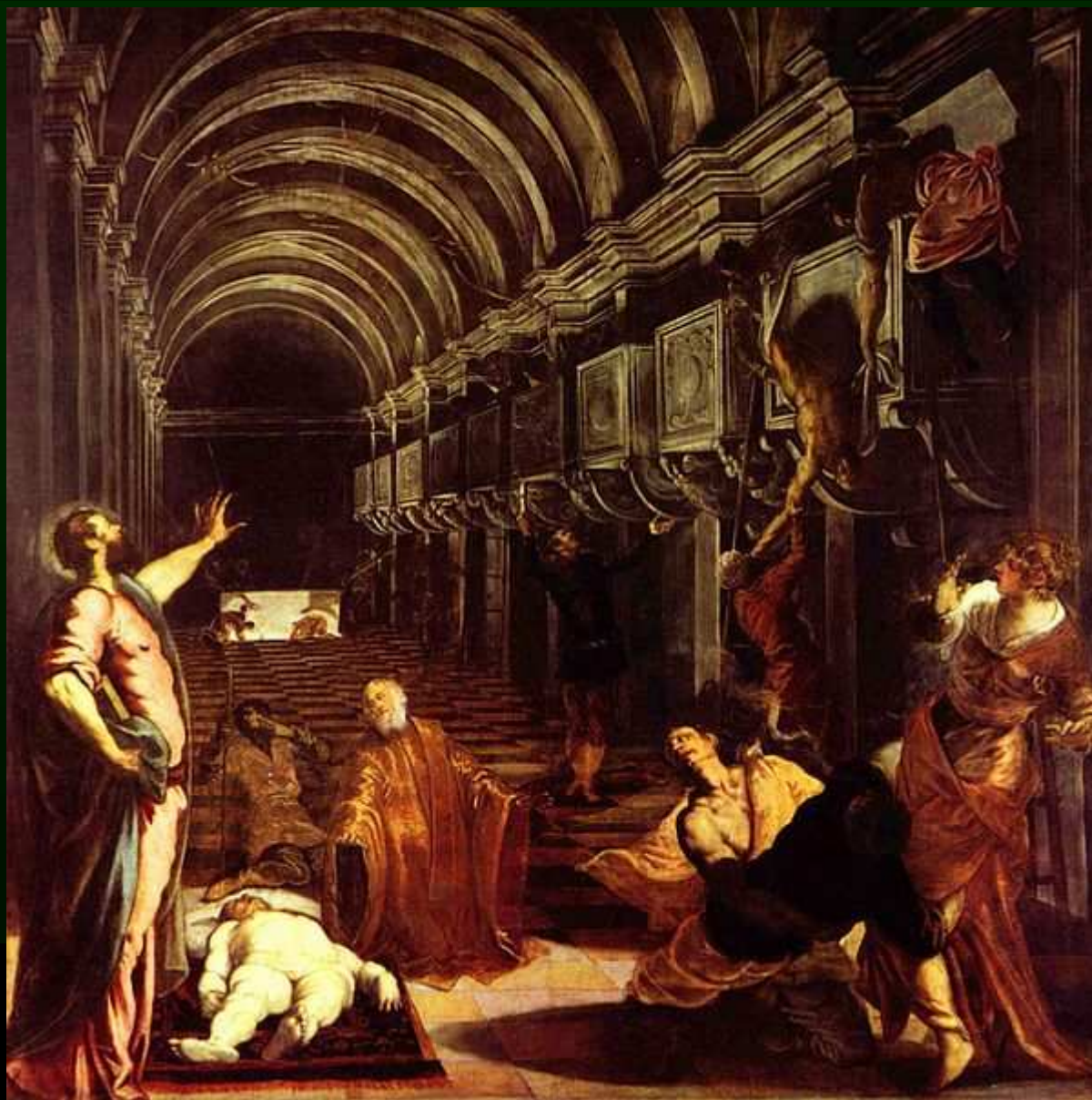
Nalezení těla sv. Marka, 1548