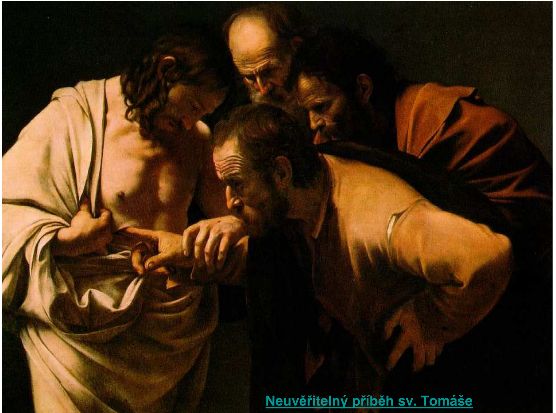
Neuvěřitelný příběh sv. Tomáše