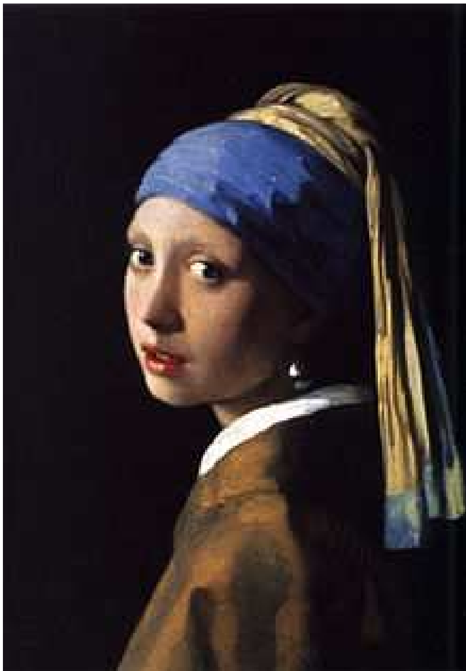
Dívka s perlou