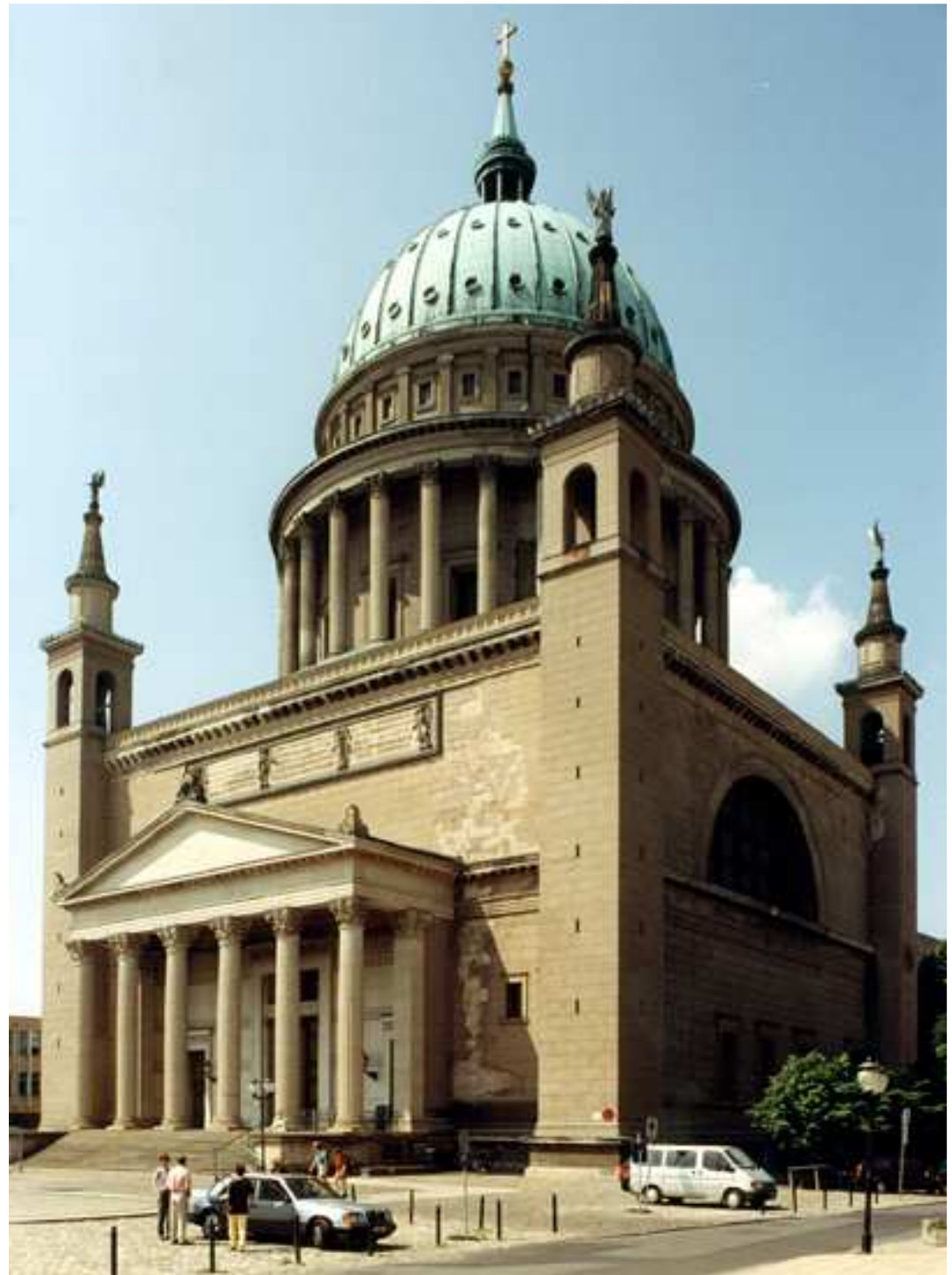
Kostel sv. Mikuláše v Potsdamu (Karl Friedrich von Schinkel)