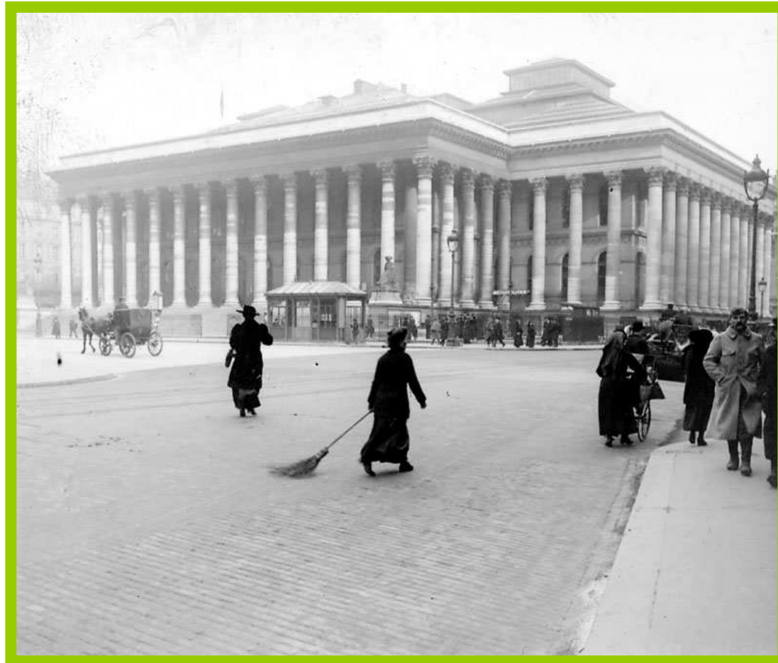
Burza v Paříži (Alexandre – Théodore Brongniart)