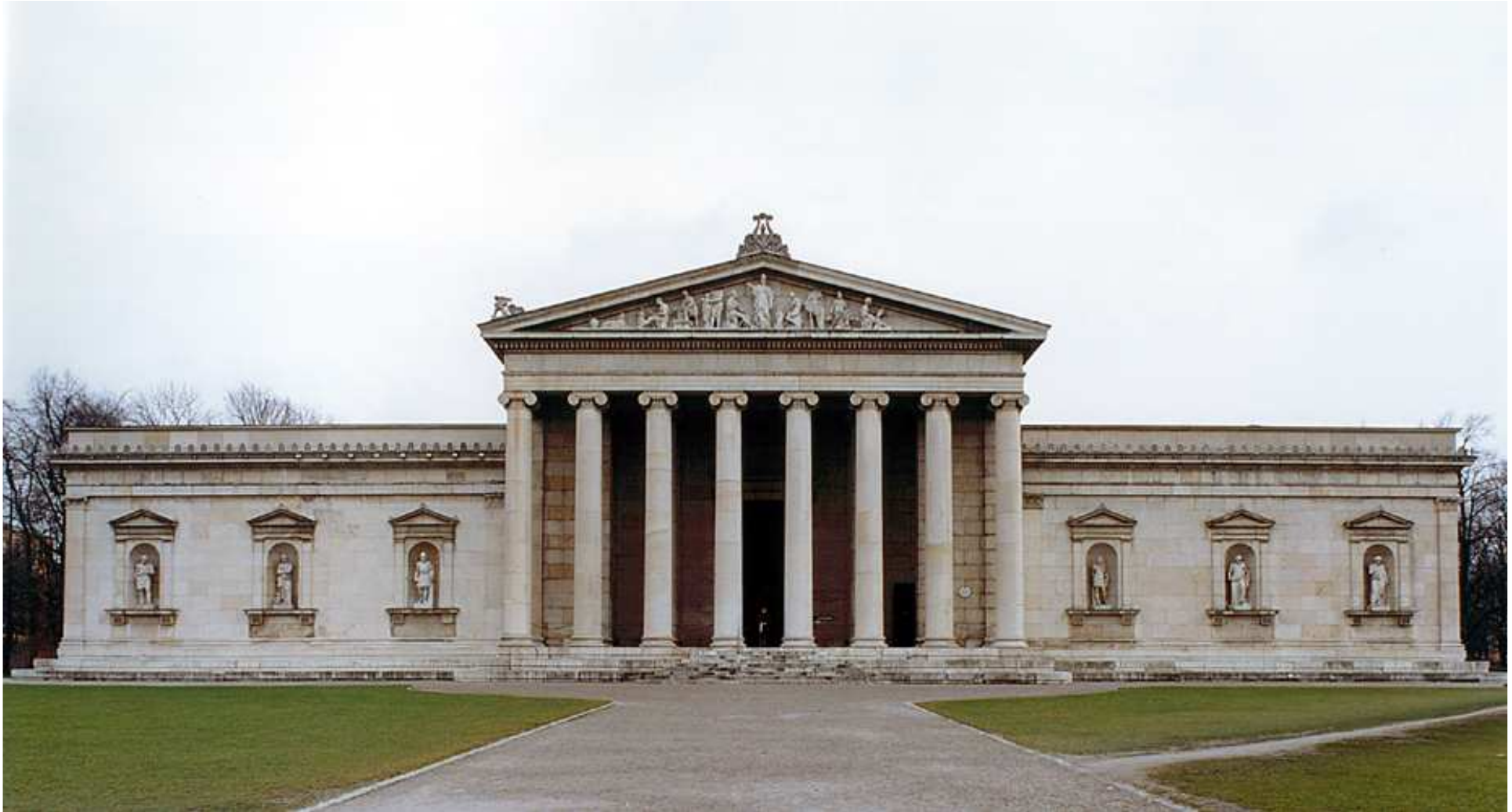
Glyptotéka v Mnichově (Leo von Klenze)