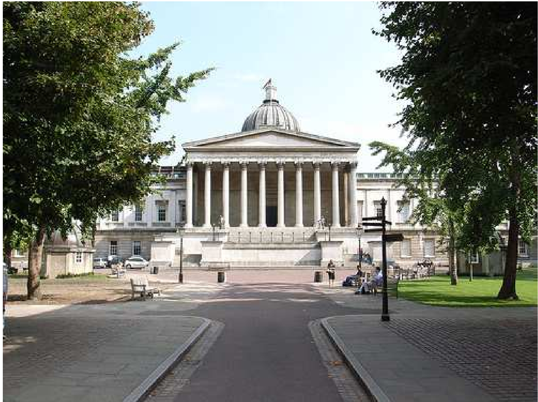
Národní galerie v Londýně (William Wilkins)