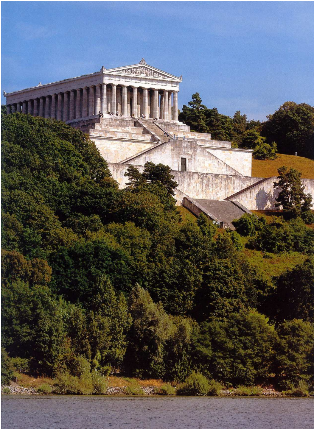
Valhala nad Dunajem u Řezna (Leo von Klenze)