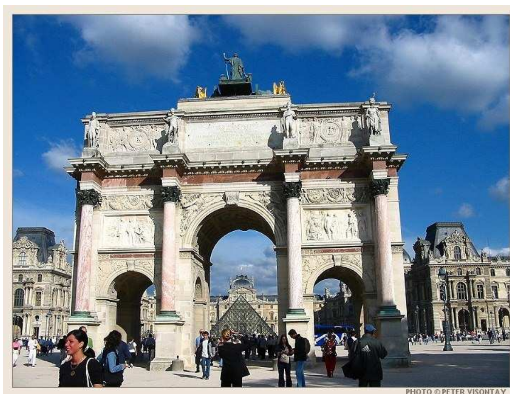
Triumfální oblouk na Carousselu v Louvru (P. F. Fontaine, Ch. Percier)