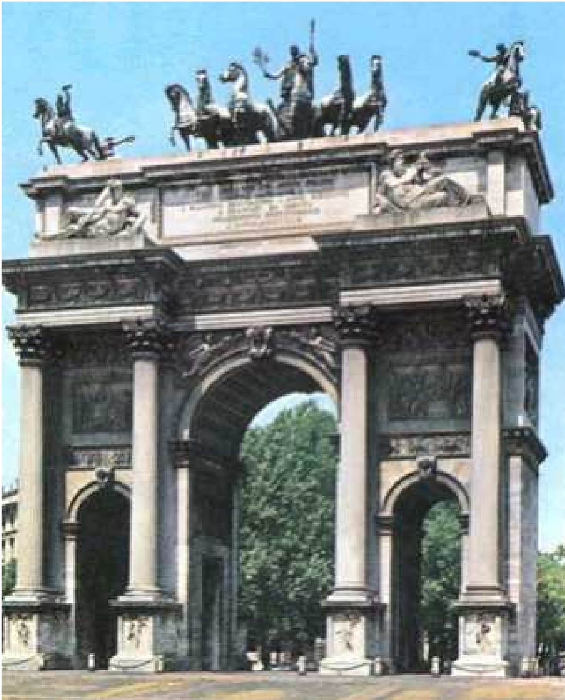
Arco della Pace (Luigi Cagnola)