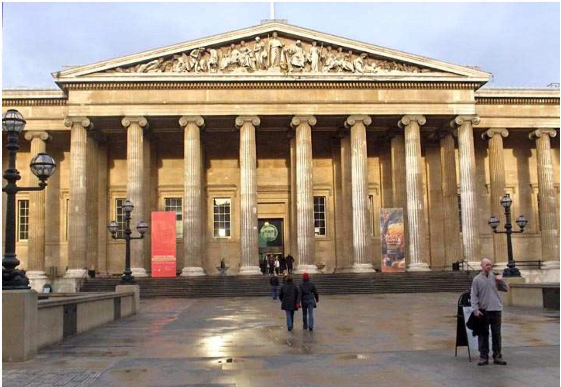
Britské muzeum (Robert Smirke)