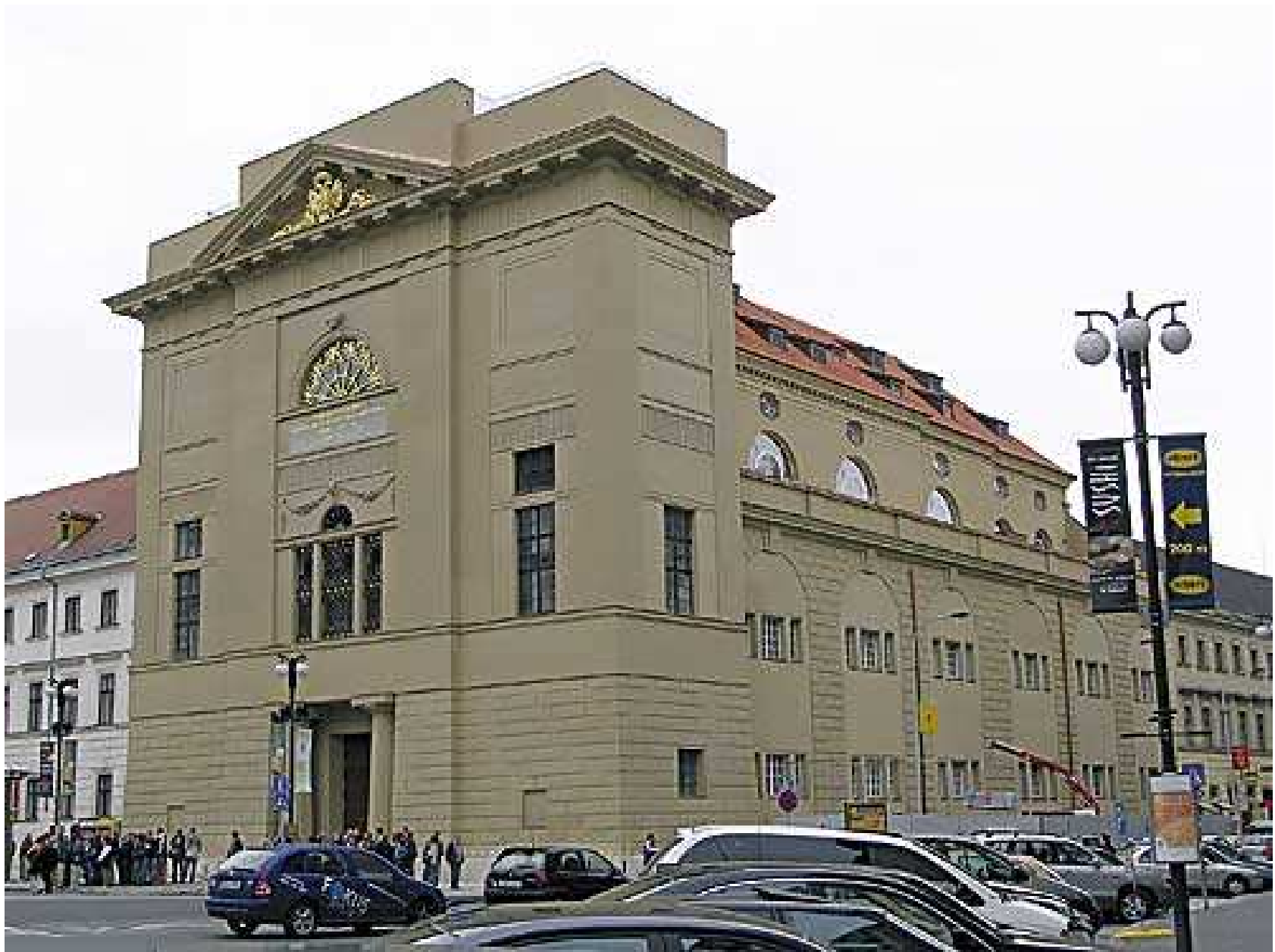
Dům U Hybernů v Praze (Jiří Fischer)