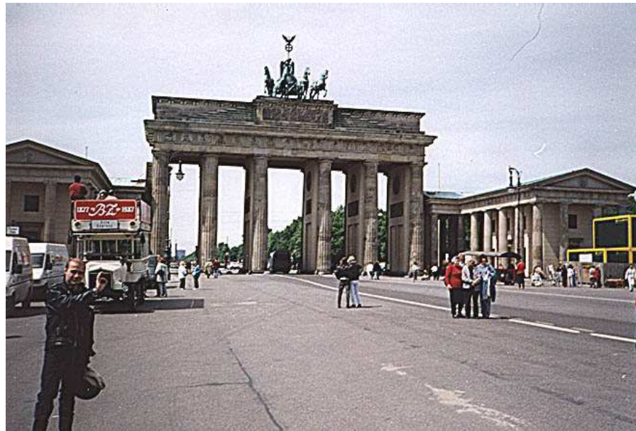
Braniborská brána v Berlíně (Karl Gothard Langhans)