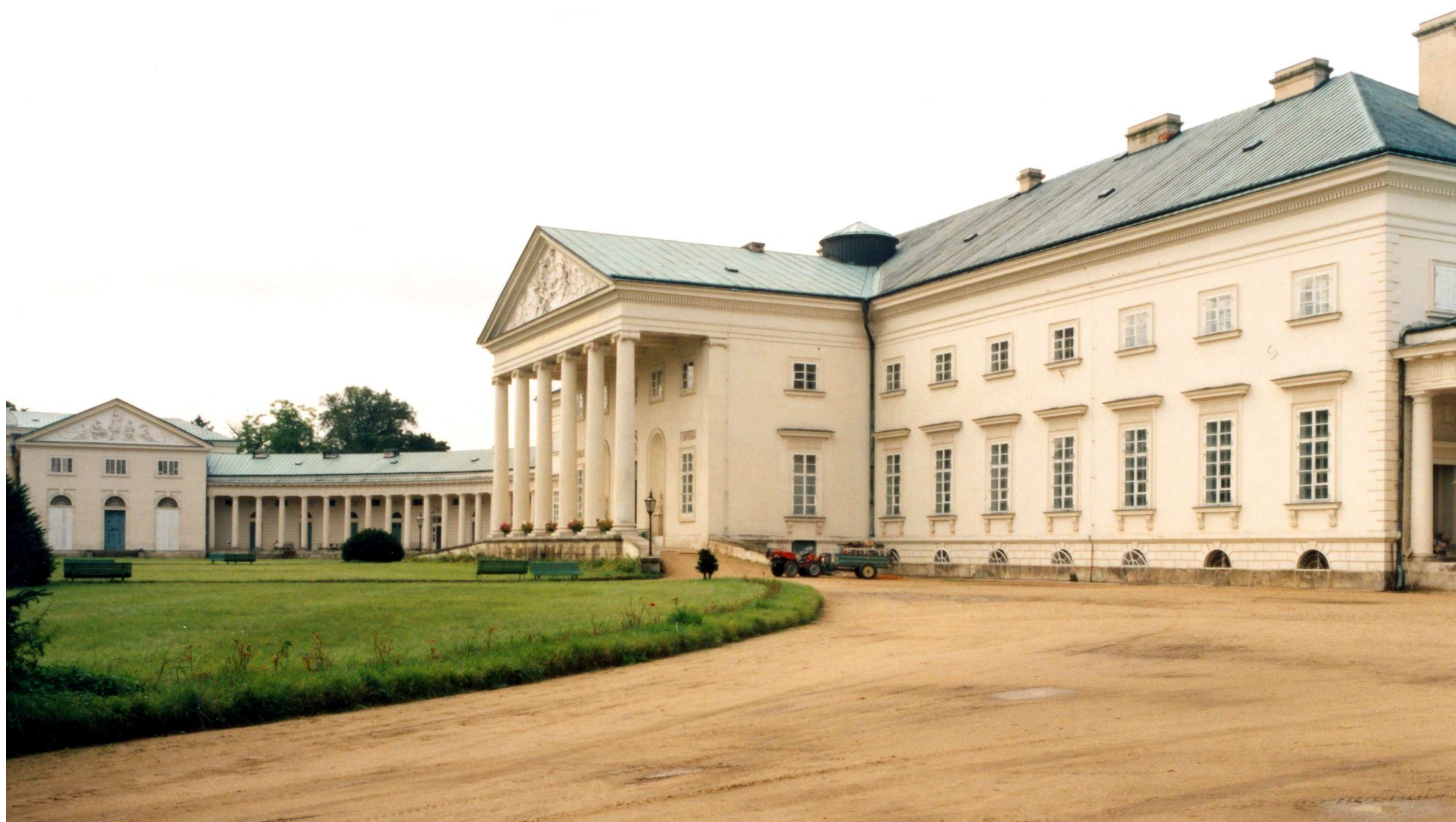
Zámek Kačina (Christian Friedrich Schuricht)