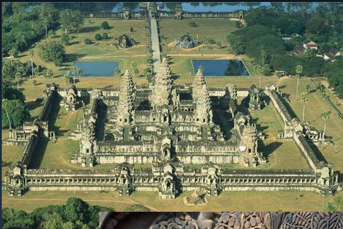
Angkor Vat (Kambodža)