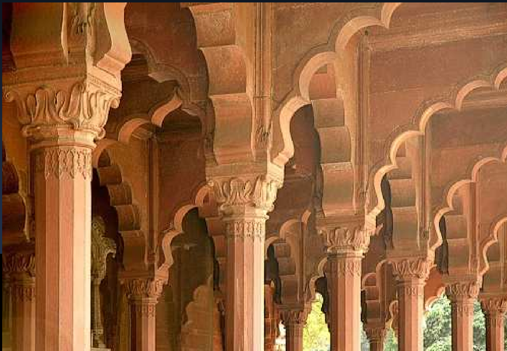
Dillí – královský palác