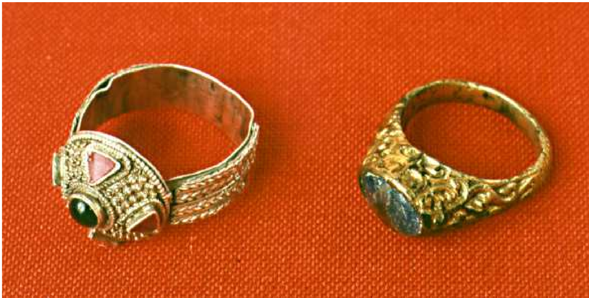
Prsteny z Pohanska u Břeclavě, pozlacené stříbro (9. století)