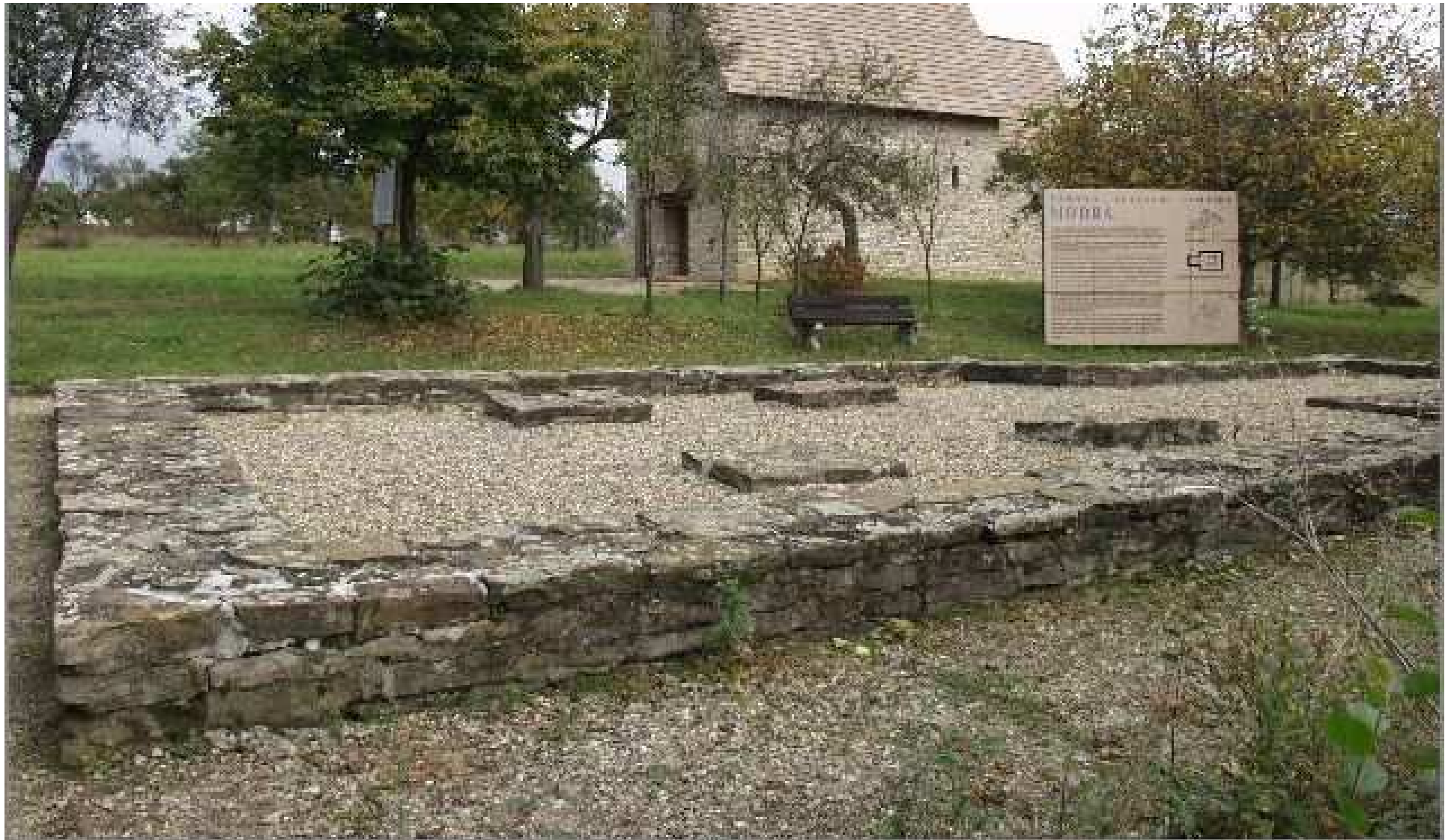
Staré Město u Uherského Hradiště – lokalita Modrá