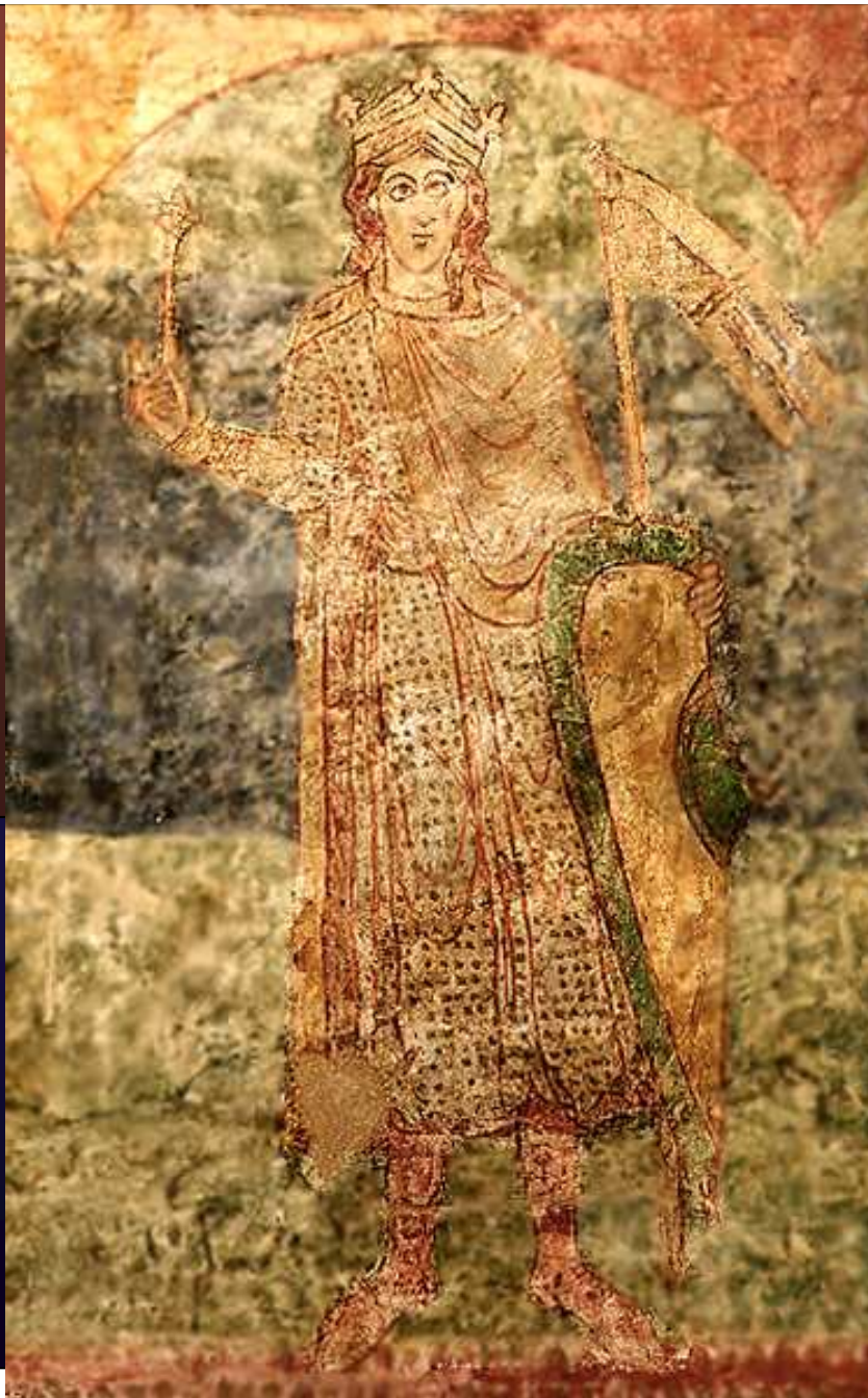
Povolání Přemysla na trůn a Vratislav I., freska z rotundy svaté Kateřiny ve Znojmě