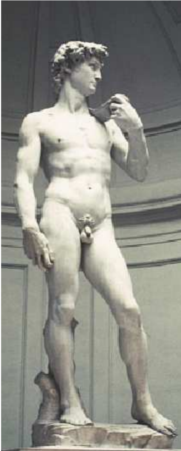
„David“ Michelangelo Buonarroti