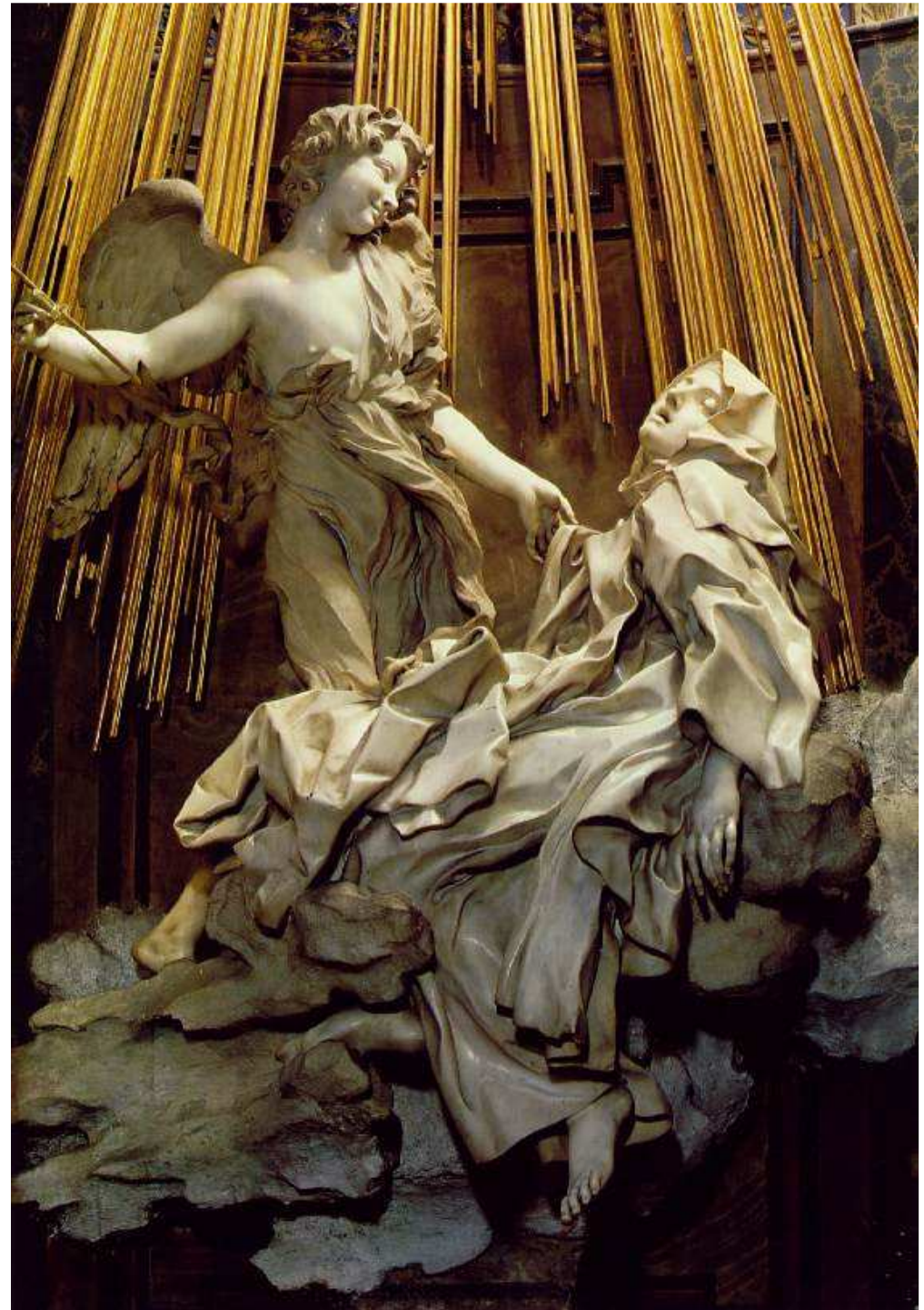
Gian Lorenzo Bernini Vidění sv. Terezie