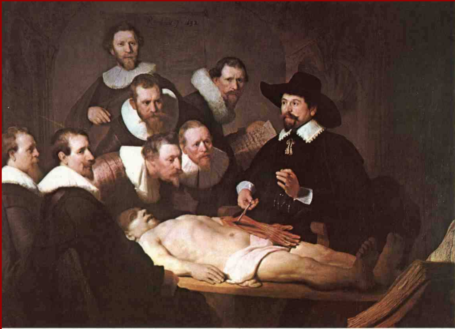
Anatomie doktora Tulpa