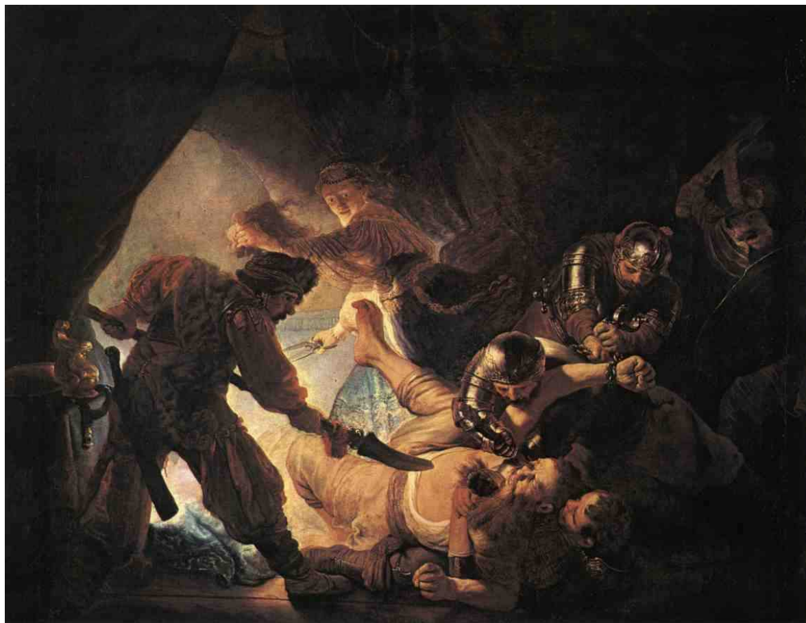
Samson oslepen Filištýny