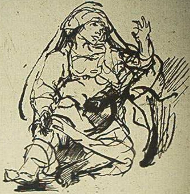
La femme malade de la peste aux cent florins peinte d'un croquis à la plume de Rembrandt (cabinet P. Duran)