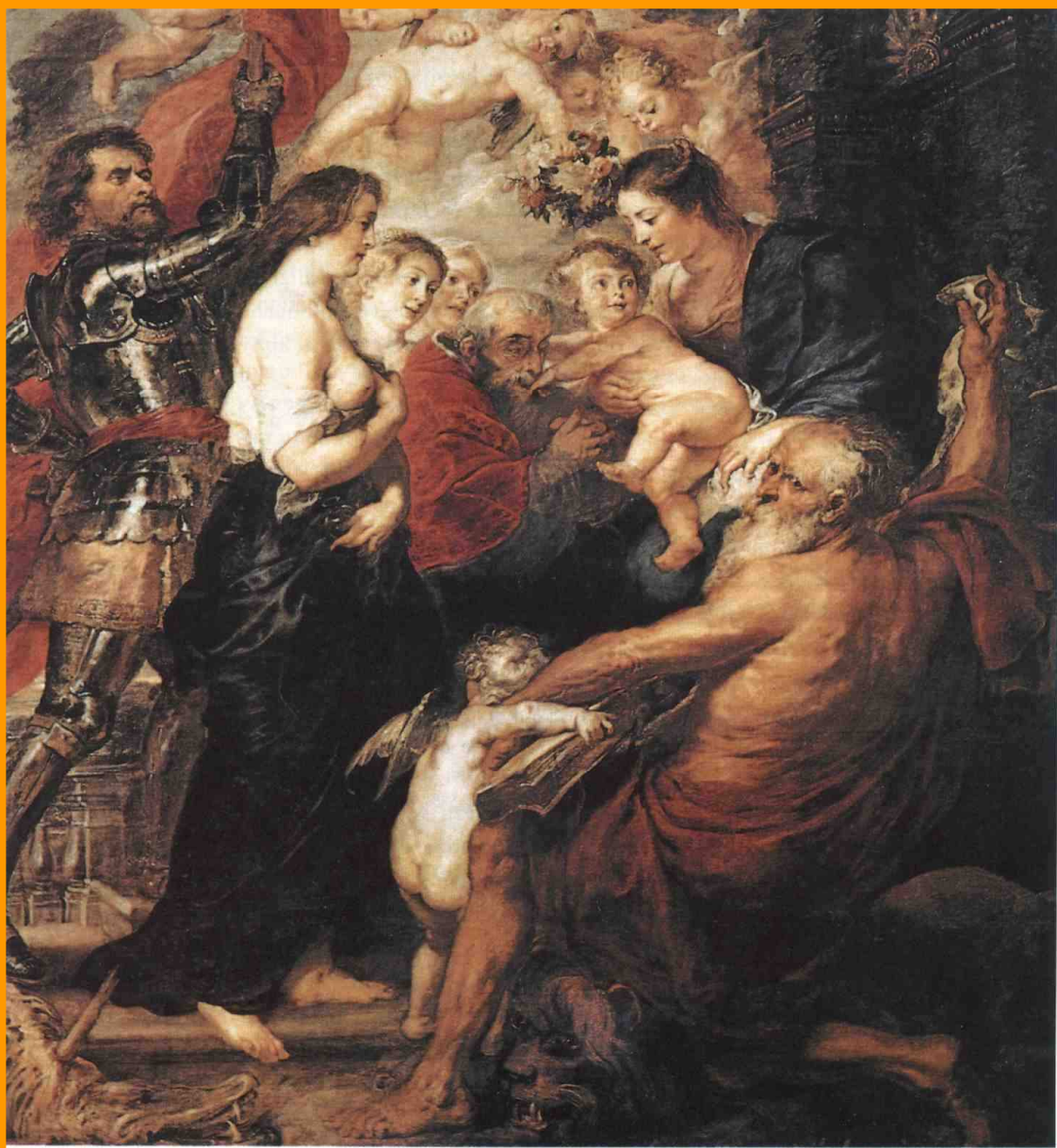
Madona se světci