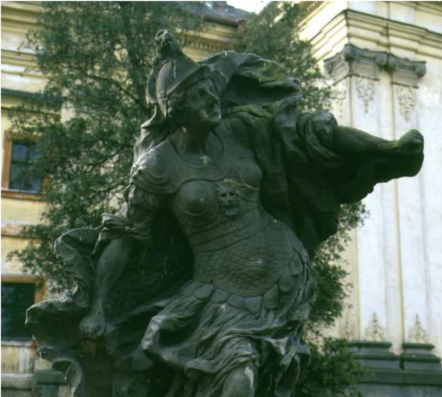
Alegorie Hněvu (Matyáš Bernard Braun) - Špitál v Kuksu