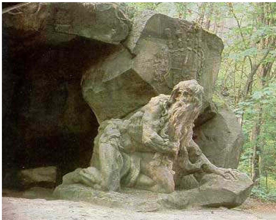
Betlém u Kuksu (Matyáš Bernard Braun)