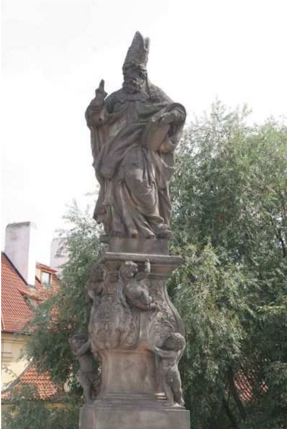
sv. Vojtěch (Ferdinad Maxmilián Brokof)