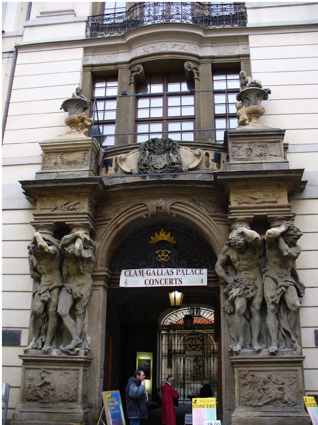
Atlanti hlavního vchodu Clam – Gallasova paláce (Matyáš Bernard Braun)